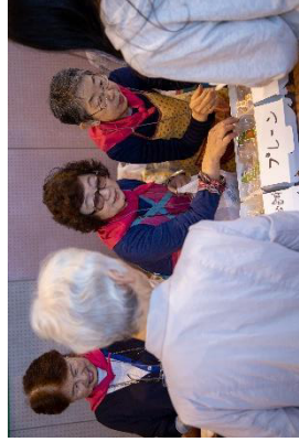
被災地商品のドーナツ、おからかりんとうは人気商品

2019 吉祥寺東部フェスティバル 10月20日(日) 和やかに 開催！ ありがとうございました！