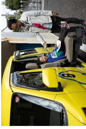
ぼくもレモンキヤブ体験！