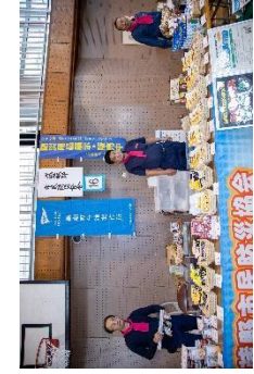
武蔵野市民防災協会も屋内で