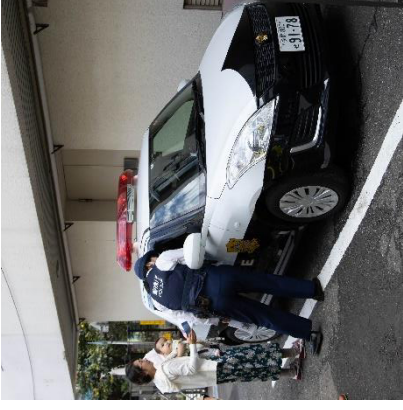
パトカーに乗ったよ！

2019 吉祥寺東部フェスティバル 10月20日(日) 和やかに 開催！ ありがとうございました！