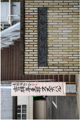
毎年、お世話になっています