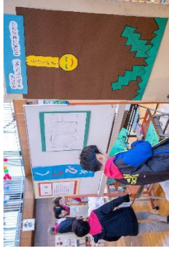
子どもスタッフも、葉っぱを切ってお手伝い