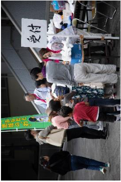
家族全員、名前を書いて