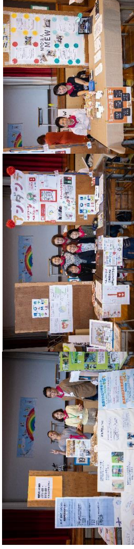
障害者福祉センター・アングダンテ・MEW のコロナボレーション