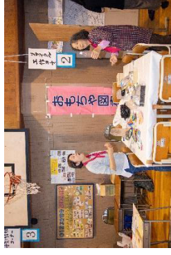
リサイクル工作コーナー